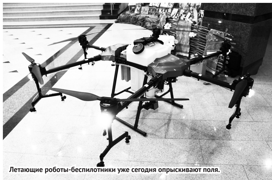
Летающие роботы-беспилотники уже сегодня опрыскивают поля.