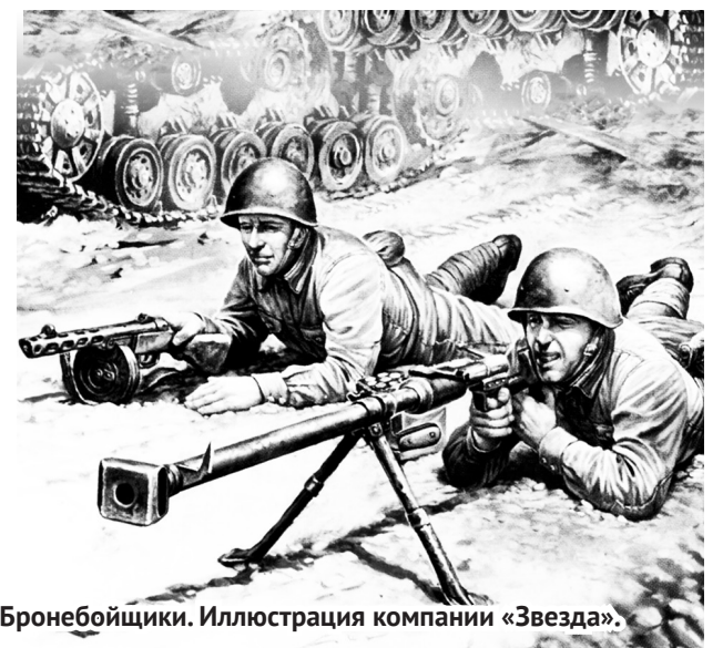
Бронебойщики. Иллюстрация компании «Звезда».