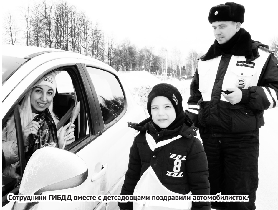
Сотрудники ГИБДД вместе с детсадовцами поздравили автомобилистку.