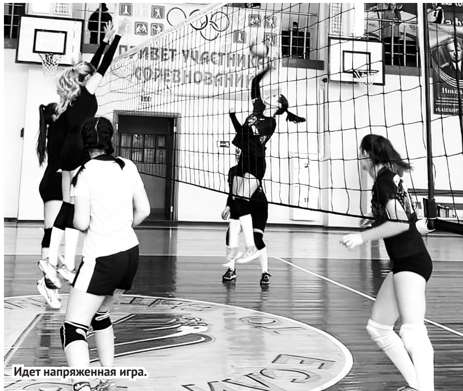
Идет напряженная игра.