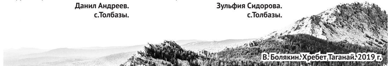
В. Болякин. Хребет Таганай. 2019 г.